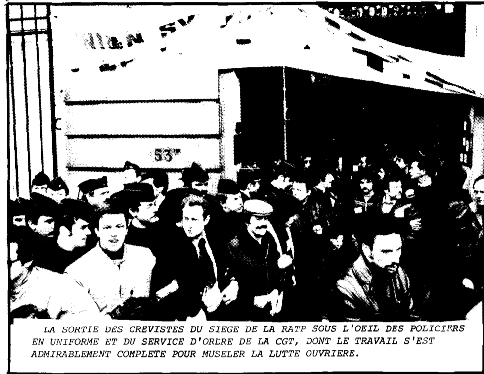
LA SORTIE DES GREVISTES DU SIEGE DE LA RATP SOUS L'OEIL DES POLICIERRS EN UNIFORME ET DU SERVICE D'ORDRE DE LA CGT, DONT LE TRAVAIL S'EST ADMIRABLEMENT COMPLETE POUR MUSELER LA LUTTE OUVRIERE.

Assez de ces illusions ! Les syndicats avancent le leitmotiv : "protection contre les agressions de voyous". Déjà, c'était un battage syndical du