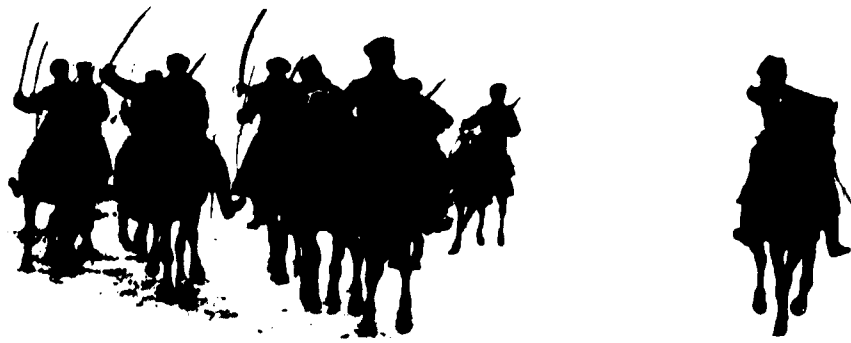
La cavalerie de l'Armée Rouge lance l'assaut contre Kronstadt, 17 mars 1921

Le but de cette vision n'est pas de prouver que les surgissements populaires sont une bonne chose, mais de MONTRER QUE LE MARXISME MENE TOUJOURS AU STALINISME, que le parti bolchevik de 1917-21 était de la même veine que les partis communistes actuels, et surtout, QUE LES REVOLUTIONS NE PEUVENT ABOUTIR QU'A UNE CHOSE : LE REMPLACEMENT D'UNE DICTATURE PAR UNE NOUVELLE, souvent pire. Le message des libéraux, qui peuvent afficher une sympathie empreinte de pitié, est essentiellement celui-là. QUELS QUE SOIENT LES MAUX DONT VOUS SOUFFREZ, UNE REVOLUTION NE PEUT QU'EMPIRER LES CHOSES.