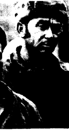
A LA SUITE DES VIOLENCES POLICIÈRES, LES MANŒUVRES DU SYNDICAT SOLIDARITE S'EM-PLOIENT A STERILISER LA COLERE ET LA DETERMINATION DES OUVRIERS DE POLOGNE.

taliste, les pays d'Europe de l'Est, comme d'ailleurs l'ensemble des pays au capitalisme faible, ou tardif, éprouvent par contre les plus grandes