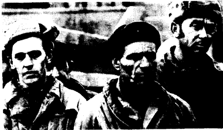
A LA SUITE DES VIOLENCES POLICIÈRES, LES MANŒUVRES DU SYNDICAT SOLIDARITE S'EM-PLOIENT A STERILISER LA COLERE ET LA DETERMINATION DES OUVRIERS DE POLOGNE.

Et c'est dans cette manœuvre d'intimidation qu'intervient directement tout le remue-ménage provoqué dans les capitales occidentales et en premier lieu à Washington où vient d'être créé à grand renfort de publicité un "Etat-Major de crise" spécialement "chargé" de suivre la situation en Pologne.