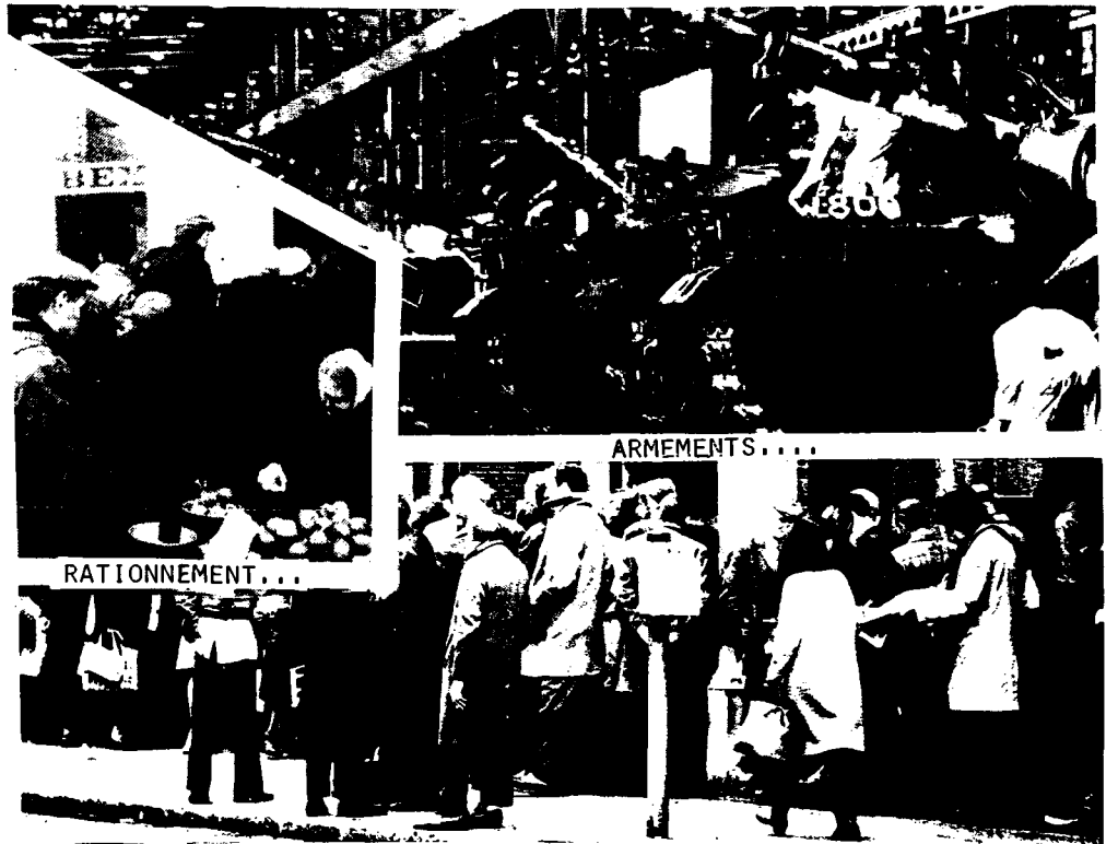
FILES DE CHÔMEURS...

Ce n'est pas la "nature" qui fait de plus en plus souffrir les hommes de misère. C'est la forme d'organisation sociale dans laquelle ceux-ci continuent de vivre. Mais "la crise" du système actuel, en plongeant le monde dans l'absurdité la plus totalitaire, crée les conditions pour son dépassement, poussant à l'unification des forces du prolétariat mondial, seules capables de dégager une perspective nouvelle pour l'humanité.