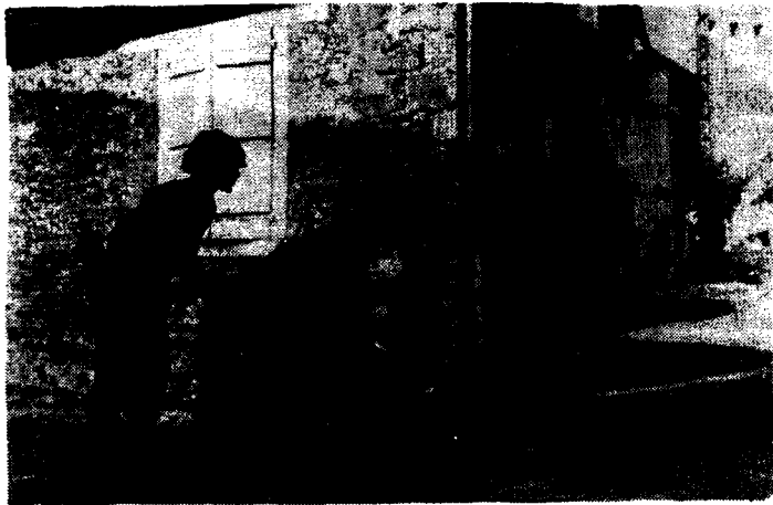
Entraînement de l'armée à la guerre civile dans un village.

IL N'EST POINT D'ETAT, MEME LE PLUS DEMOCRATIQUE QUI N'AIT DANS SA CONSTITUTION DE BIAIS AUX RESTRICTIONS PERMETTANT A LA BOURGEOISIE DE LANCER SES TROUPES CONTRE LES OUVRIERS, DE PROCLAMER LA LOI MARTIALE, ETC." (LENINE, "Le renégat Kautsky")