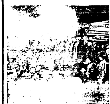
BROCHURE N°3 AOÛT 79

C'est là le résultat du contrôle syndical sur les luttes.