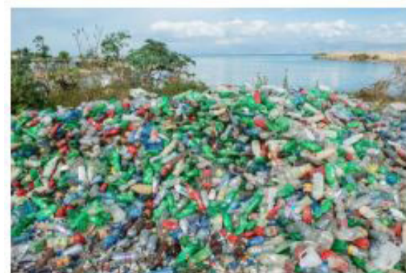
Le plastique à la plage

Il ne peut y avoir de capitalisme « vert ». Toute la rhétorique de la bourgeoisie, de l'extrême droite à l'extrême gauche, prétendant pouvoir « réguler », « superviser », « réformer » le capitalisme pour qu'une « économie verte » puisse se développer, est un mensonge pur et simple. Aucune loi, aucune charte, aucune pression publique ne peut ôter au capitalisme sa raison d'être : exploiter les hommes et la nature pour produire, vendre et faire du profit. Et tant pis si les hommes et la nature en meurent. Écrites il y a près de 160 ans, les paroles de Karl Marx dans le premier volume du Capital semblent avoir été écrites aujourd'hui : « Dans l'agriculture comme dans la manufacture, la transformation capitaliste de la production semble n'être que le martyrologe du producteur [...] Dans l'agriculture moderne, de même que dans l'industrie des villes, l'accroissement de productivité et le rendement supérieur du travail s'achètent au prix de la destruction et du tarissement de la force de travail. En outre, chaque progrès de l'agriculture capitaliste est un progrès non seulement dans l'art d'exploiter le travailleur, mais encore dans l'art de dépouiller le sol ». Ce système d'exploitation ne cessera de piller les ressources naturelles et d'empoisonner la Terre. La seule solution est de renverser le capitalisme. Mais quel autre système peut-il représenter une alternative ? (Voir article en page 3).