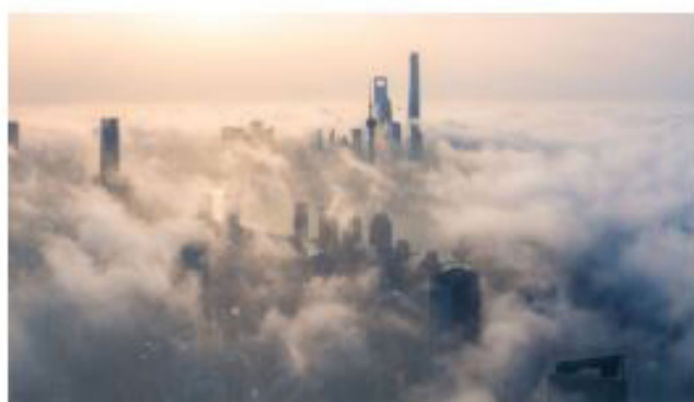
Le smog sur la ville

Mais avant le capitalisme et son insatiable besoin d'expansion, ces problèmes écologiques étaient limités et locaux. Après des millénaires de lente évolution, le capitalisme a décuplé ses forces productives en quelques décennies. D'abord en Europe, puis sur tous les autres continents, il s'est répandu partout, transformant la nature